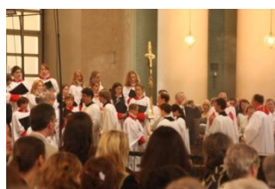
Tournee naar Berlijn (2011)