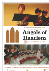
Angels of Haarlem (2011)