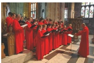
Tournee naar Sheffield (2012)