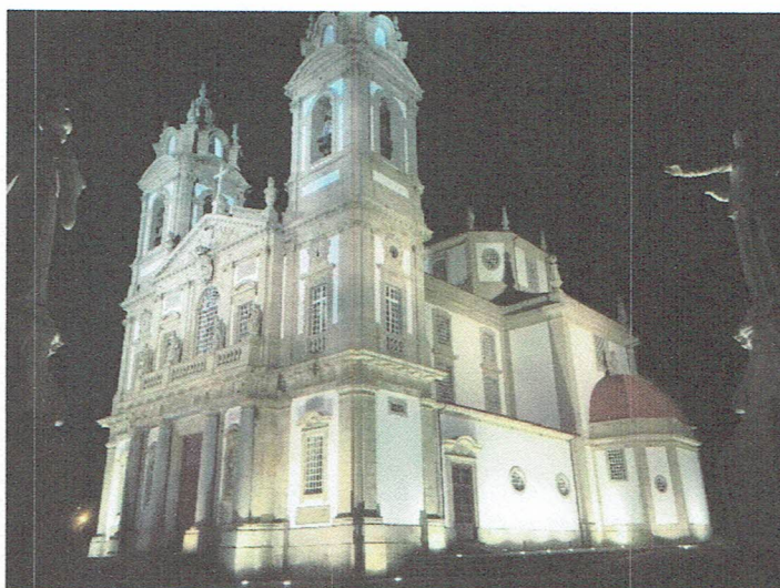
Bom Jesus do Monte, Braga – oktober 2016